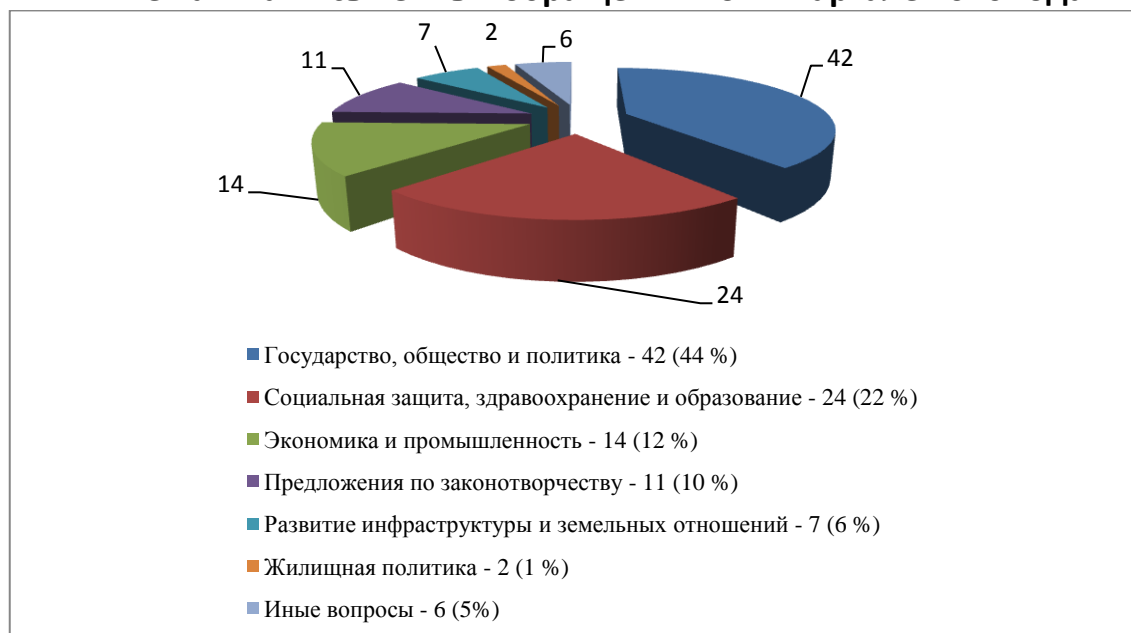
Тематика письменных обращений во 2 квартале 2020 года

Тематика большей части обращений относилась к вопросам государства, общества и политики – 42 обращения (44 %), в том числе: соблюдение и защита конституционных и гражданских прав человека – 16, восстановление гражданства – 9; разъяснения действий в период режима самоизоляции и карантина – 5; деятельность депутатов – 4; выдача разрешений на перемещение в период самоизоляции – 3; вопросы судебных и правоохранительных органов – 2; работа органов местного самоуправления – 2; действия должностных лиц – 1.