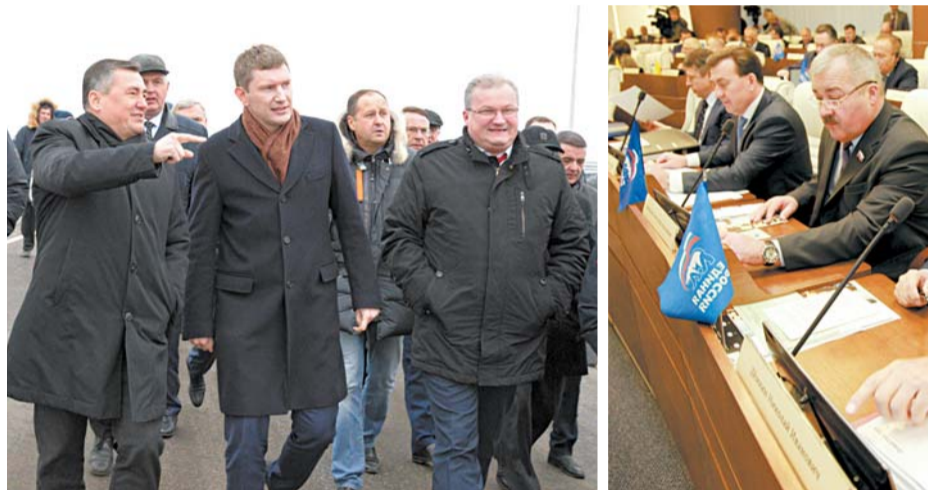
6 апреля 1994 г. состоялась первое заседание нового законодательного органа государственной власти региона. За всю историю работы Заксобранья в Прикамье приняли более трёх тысяч постановлений и законов.