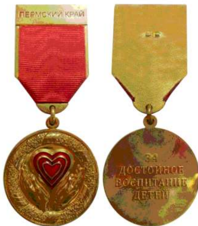
РИСУНОК ПОЧЕТНОГО ЗНАКА "ЗА ДОСТОЙНОЕ ВОСПИТАНИЕ ДЕТЕЙ"