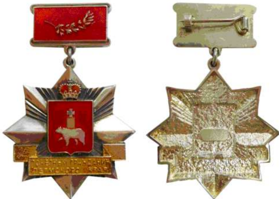
РИСУНОК НАГРУДНОГО ЗНАКА К ПОЧЕТНОМУ ЗВАНИЮ "ПОЧЕТНЫЙ ГРАЖДАНИН ПЕРМСКОГО КРАЯ"